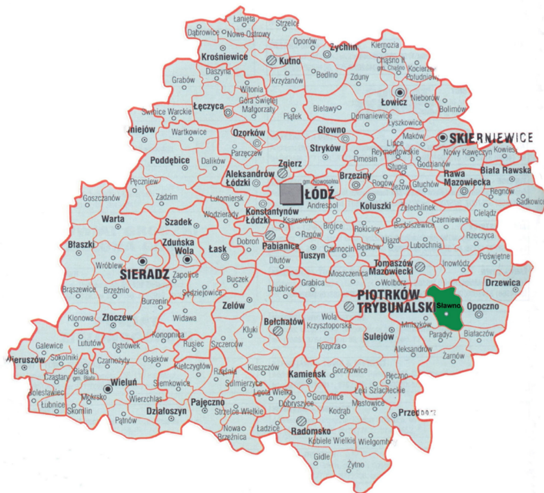
POŁOŻENIE GMINY SŁAWNO NA TLE WOJEWÓDZTWA ŁÓDZKIEGO